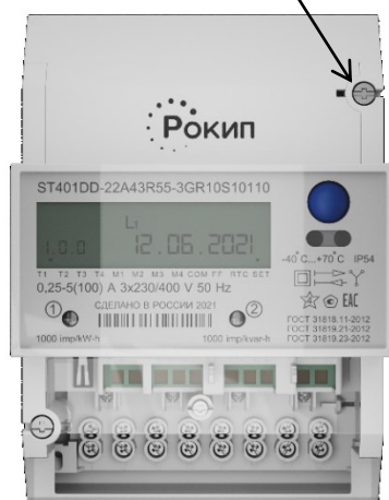
в) счетчик в исполнении корпуса для DIN-рейки